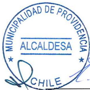
[Handwritten signature] D. EVELYN MATTHEI FORNET ALCALDESA MUNICIPALIDAD DE PROVIDENCIA

DÉCIMA CUARTA: El presente convenio se firma en tres ejemplares, quedando uno en poder del Servicio de Salud, uno en el de la Municipalidad y el otro, en la División de Atención Primaria, de la Subsecretaría de Redes Asistenciales del Ministerio de Salud.